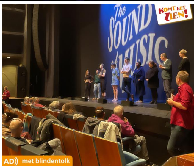
AD)) met blindentolk